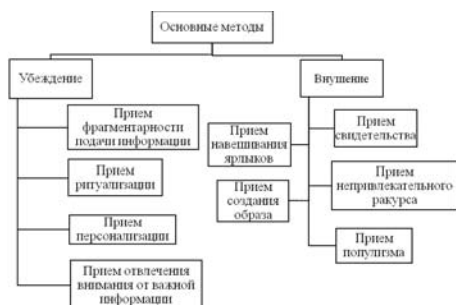
Рис. 1. Основные методы воздействия СМИ на общественное сознание.

мация, поданная мелкими порциями, не позволяет ей эффективно воспользоваться. [7]